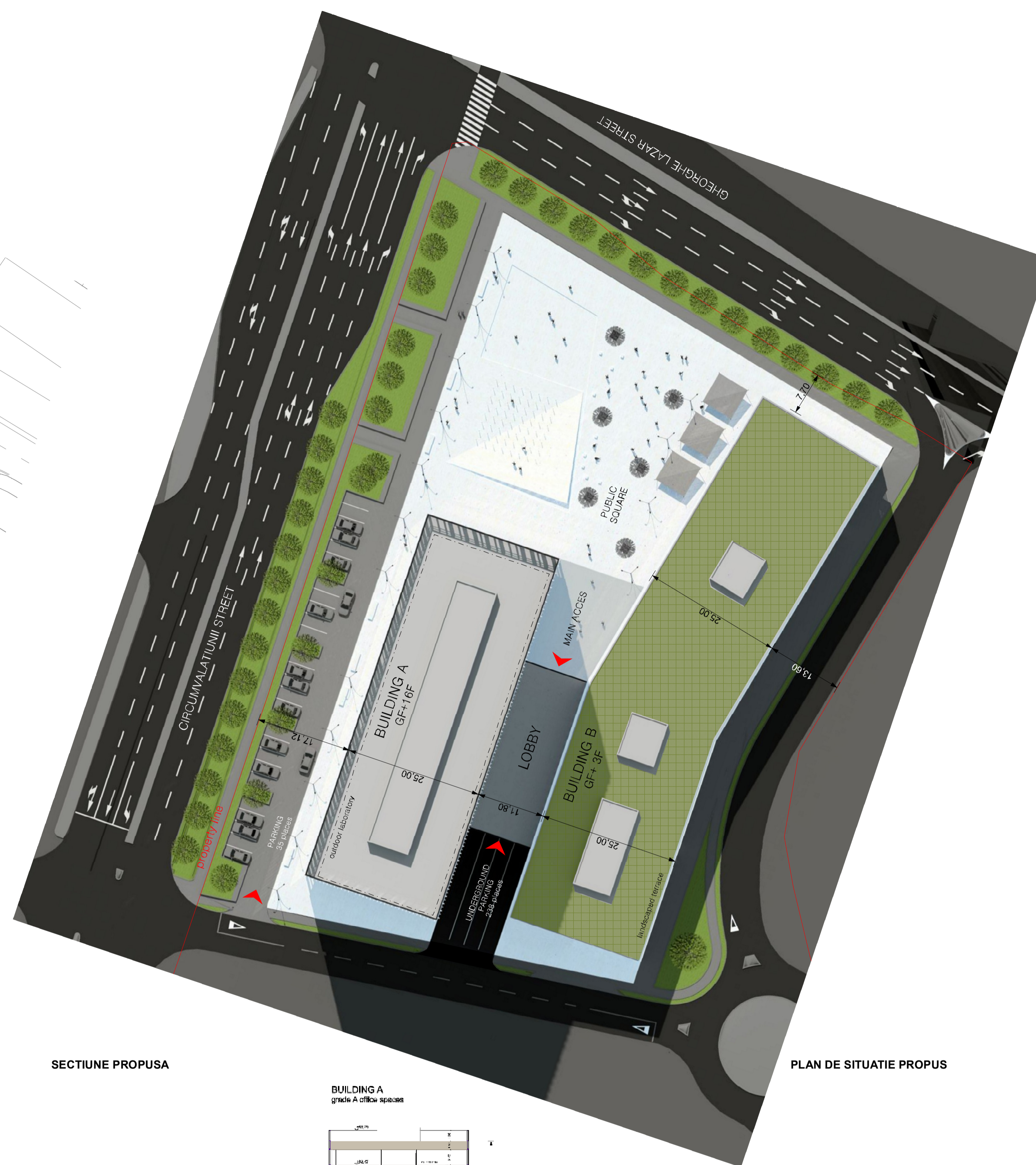
PLAN DE SITUATIE PROPUS